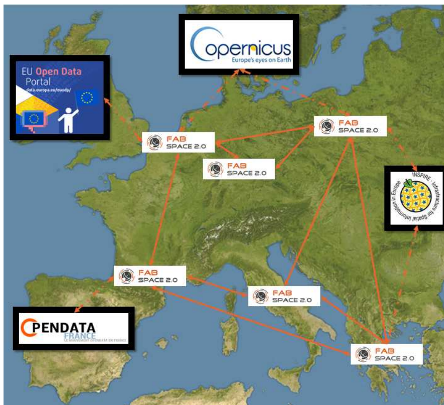
Figure 1: Utilisation de TerraHUB pour la mise en place du réseau européen FabSpace : accès et partage des données spatiales.

également favoriser les échanges et permettra la création d'une communauté de partage entre utilisateurs.