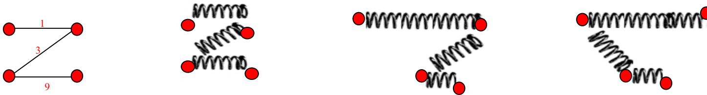
Figure 1. Principe de l'algorithme de ressorts.

Figure 1, le principe des algorithmes FDP est illustré. La première figure à gauche représente un graphe non orienté dont la valeur des liens est affichée. Le second représente ce même graphe, mais pour lequel les liens ont été assimilés à des ressorts et les sommets à des anneaux. Dans la troisième figure, les ressorts sont contractés ou relâchés selon l'importance du lien. La dernière figure illustre l'apport de cet algorithme, permettant de visualiser le graphe sous sa forme la plus planaire et la plus significative.