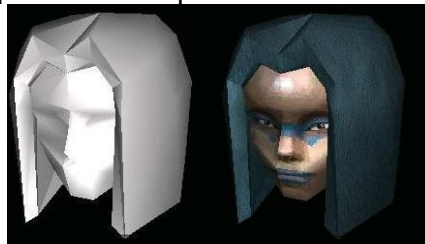
Exemple de surface non unie et lissée ( http://nicox.free.fr/xoom/xoom.html )

On souhaite développer une technique, à partir du modèle d'ombrage de Gouraud, permettant d'aboutir à l'affichage d'une surface présentant l'aspect non uni suivant :