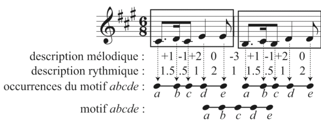
FIG. 1 – Une partition et sa description suivant les dimensions mélodique et rythmique. Les deux motifs encadrés sont deux occurrences d'un motif. Le motif ainsi que ses occurrences sont représentés sous la forme de chaînes d'états.

Lorsqu'une suite de descriptions est répétée à divers instants d'une pièce musicale, chacune de ses répétitions sera appelée une occurrence du motif que constitue cette suite de descriptions. Le motif pourra être représenté sous la forme d'une chaîne d'états, et les descriptions du motif