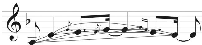
FIG. 9 – Afin de détecter la répétition de la structure profonde, un graphe syntagmatique (indiqué en gris) est construit, et la recherche de répétition motivique est effectuée le long des différentes branches

Une nouvelle méthode de résolution est actuellement en cours d'élaboration, fondée sur une identification adaptative, et sur une réduction de l'espace de solutions par l'intermédiaire d'heuristiques basées sur des considérations d'ordre perceptuel. Pour cela, sur la chaîne syntagmatique – que constitue la succession apparente de notes de la séquence musicale – est construit un graphe syntagmatique contenant l'ensemble de toutes les connexions perceptibles entre notes temporellement proches (cf. FIG. 9). Des hypothèses d'ordre cognitif et des expérimentations informatiques permettent de mettre en place un ensemble de règles limitant la combinatoire du graphe syntagmatique. Dans un second temps, l'algorithme d'extraction motivique, initialement conçu pour l'analyse de chaînes syntagmatiques, sera généralisé à ce nouveau cadre, à travers un parcours de toutes les chaînes contenues au sein du graphe syntagmatique. L'élaboration d'un système complet et fiable de règles de réduction du graphe syntagmatique nécessitera un effort de recherche important. D'autre part, ce nouveau paradigme induit de nouveaux facteurs de redondance combinatoire qu'il est nécessaire de contrôler de manière optimale.