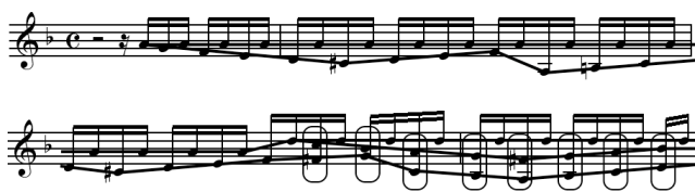
FIG. 10 – Construction d'un graphe syntagmatique à partir d'une polyphonie.

Au sein d'un flux polyphonique émergent non seulement des chaînes monodiques, mais également des groupements de notes qui s'agglomèrent en raison de leur proximité temporelle, que l'on pourra appeler des agrégats , et qui forment diverses constructions musicales telles que les accords, les degrés ou les modes. Des exemples d'accords sont encadrés dans la FIG. 10. De même que les motifs résultent de répétitions de chaînes monodiques, la répétition d'agrégats induit la formation de classes d'agrégats. D'autre part, les agrégats se succédant forment eux-mêmes des chaînes d'agrégats. Là où la description de chaînes monodiques consistait simplement en une suite de distances entre notes successives, la description de chaînes d'agrégats aboutit à un réseau complexe de distances entre notes d'agrégats successifs, ainsi que de distances entre classes d'agrégats, qu'il faudra formaliser et modéliser. Il s'agira par la suite de généraliser aux chaînes d'agrégats la problématique de recherche de répétition de chaînes. La résolution de l'ensemble de ces problèmes permettra d'assurer une modélisation complète des mécanismes en jeu dans l'analyse motivique.