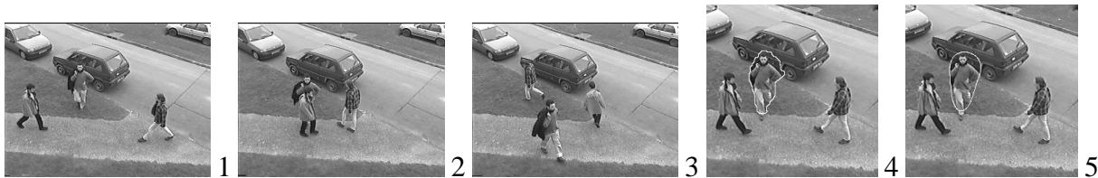
FIG. 3 – (1, 2, 3) : Trois images d'une séquence piétons avec occultation ; représentation par contour de Fourier : (4) contour initial ; (5) contour calculé par transformation de Fourier inverse des 6 premiers coefficients de Fourier du contour initial.

Dans la séquence suivante, trois piétons se déplacent avec des trajectoires non rectilignes uniformes, d'une part à cause d'une accélération non constante et d'autre part à cause de changements de direction. De nombreux problèmes d'occultations se posent lors du croisement d'individus dans le champ en deux dimensions de la séquence (exemple en figure 3(1,2,3)).