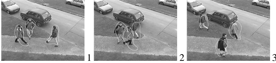
FIG. 5 – Contours estimés avec \sigma_v = 0.08 , N_U = 10 et 100 particules pour les images 19, 39 et 79 de la séquence.

de courbes de type spline , il semble intéressant d'utiliser les premiers coefficients de Fourier obtenus par transformation de Fourier discrète des points du contour.