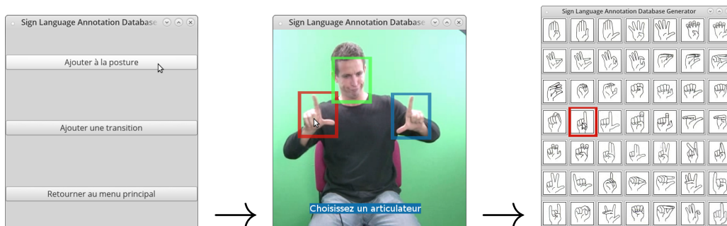
FIGURE 2 – L'utilisateur décrit la main gauche

L'utilisateur aura la liberté d'ajouter plus d'information s'il veut, par exemple la configuration de la main gauche (fig. 2).